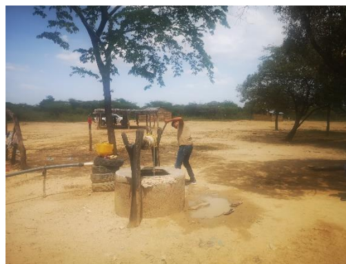
PANORAMICA DE LA COMUNIDAD Y VIVIENDAS