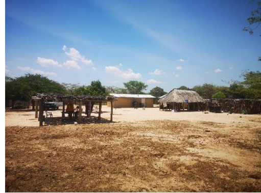
PANORAMICA DEL CORRAL